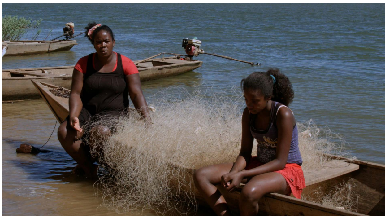
Figura 2 – É um olhar mais atento às concepções e práticas daqueles para quem o rio representa uma forma de sobreviver, existir e resistir

sensível às suas dinâmicas. Em “Pensando como um rio” 4 , o historiador norte-americano Donald Worster argumenta que o ciclo da água é metáfora do próprio mundo natural, seguindo formulação do grande conservacionista Aldo Leopold, para quem a natureza é “um rio circular” 4 . Segundo Worster, as interferências nos ciclos hidrológicos em favor da agricultura industrializada ignoram a lógica do próprio rio, que com isso sofre efeitos dramáticos, entre eles a salinização, o que aliás vem ocorrendo no São Francisco, como mostra o filme. Em contraposição a tal padrão, Worster defende uma agricultura capaz de atuar em sinergia com os fluxos de água, atenta ao ecossistema local, econômica e sustentável segundo os parâmetros do ciclo hidrológico do rio. A visão capitalista para ele é incompatível com a ideia de “rio circular” 4 , já que a harmonia ecológica não é valor de mercado. Mas o estabelecimento dessa agricultura efetivamente sustentável requer articulações coletivas, disposição pública para contrabalançar os interesses do mercado e novos quadros, novas percepções e uma nova ética. Para Worster, agricultura sustentável é aquela praticada nos marcos dos ciclos hidrológicos locais. O filme exemplifica o perfil de cultivo mais adequado às circunstâncias ecológicas como aquele praticado ‘do jeito tradicional’ que, por exemplo, mantém as matas ciliares com a finalidade de conservar os mananciais de água.