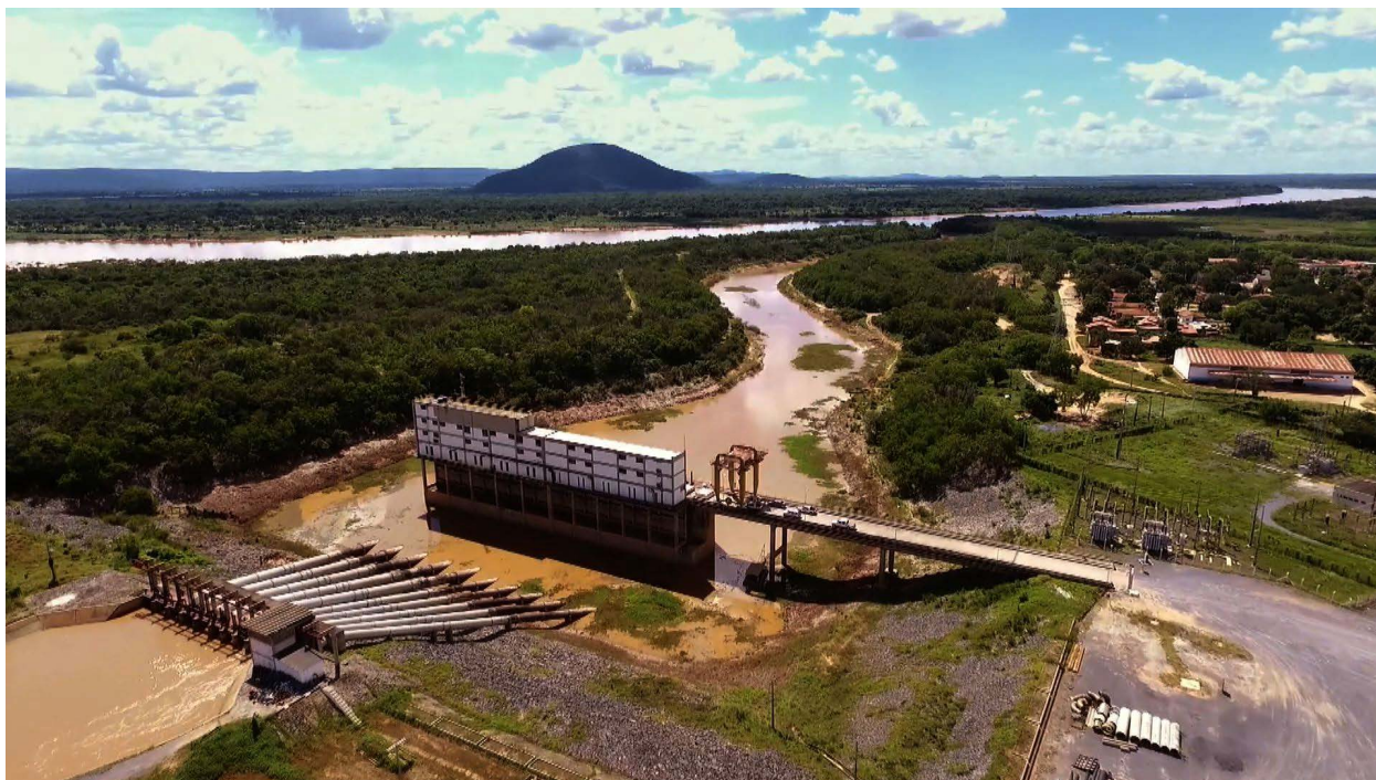
Figura 1 – O filme apresenta uma crítica à 'metanarrativa do desenvolvimento', com seu viés colonial, universalista e etnocêntrico que tudo reduz à razão técnica

Se no relatório de Lutz e Machado, as populações locais ocupam o segundo plano de uma minuciosa descrição das paisagens e doenças, no documentário são elas as protagonistas que relatam a estreita relação com o rio e os modos como as intervenções sobre as águas impactam suas atividades e existências. Não somente os ribeirinhos, mas também representantes de agências privadas e estatais, lideranças de movimentos sociais e pesquisadores compõem o coro de vozes que documenta os múltiplos aspectos envolvidos nas ações direcionadas ao São Francisco. Essa polifonia representa um ponto forte do documentário, que desta forma escapa do denunciismo e maniqueísmo implícitos nas reações contrárias a iniciativas como a polêmica transposição do rio. Aliás, o projeto que trouxe o velho Chico ao proscênio da arena pública desde que foi retomado pelo governo Lula não é o cerne da narrativa do filme, mas aparece nas imagens e depoimentos como mais uma intervenção que aborda suas águas como recurso para propósitos como irrigação de culturas agroexportadoras ou geração de energia. Embora a transposição não seja abordada de forma direta, o documentário fornece fartos subsídios da complexidade de interesses, motivações e consequências que acompanham o projeto. Assim, indica que a intrincada trama social, econômica, política e ambiental envolvida na transposição de forma alguma se esgota nas narrativas esquemáticas e dualistas que inundaram a mídia nos últimos anos.