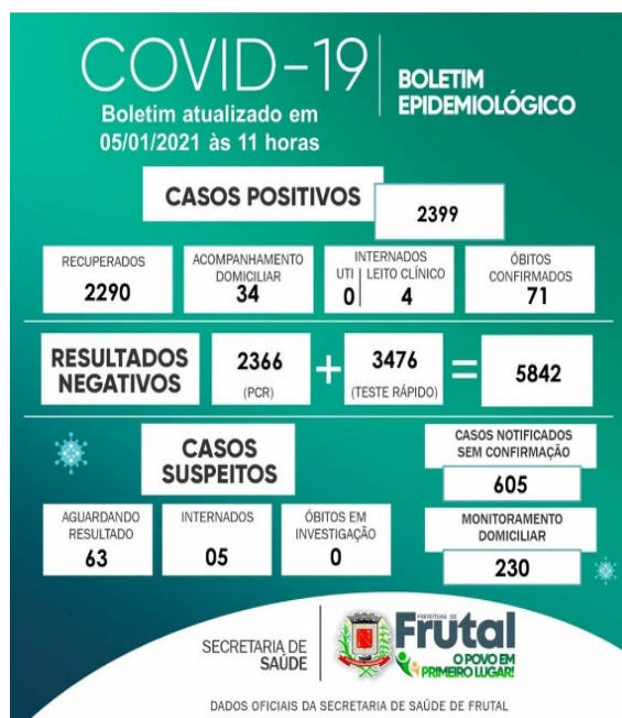
Figura 4 – Boletín Epidemiológico, 05 de enero de 2021

Las publicaciones mantuvieron este patrón de formato a lo largo de 2020. Cabe recordar que, entre el 14 de agosto y el 12 de noviembre de ese año, no hubo publicaciones en la página debido a las elecciones municipales de 2020. A partir de enero del 2021, con la elección de la nueva administración municipal, el formato sufrió algunos cambios que marcan la nueva administración. Se reemplazó el tono azul por verde y también se actualizó el logotipo de la alcaldía, como se muestra en la Figura 4.