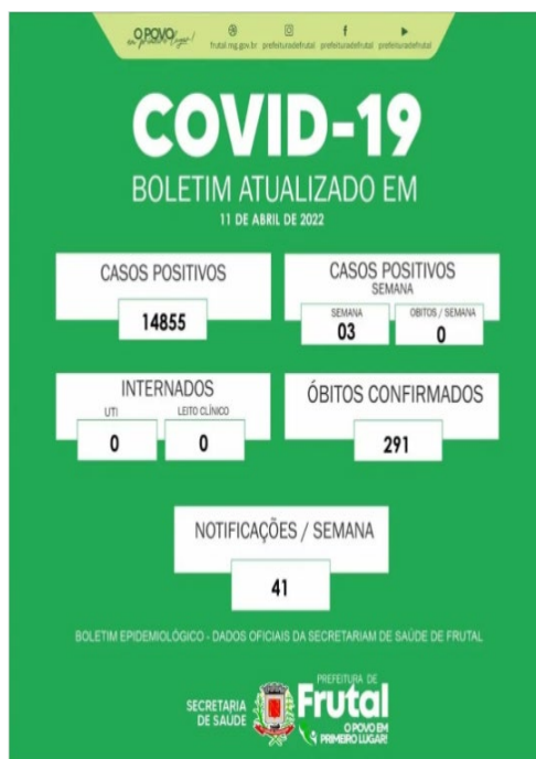
Figura 5 – Boletín Epidemiológico, 11 de abril de 2022

En la siguiente edición, publicada el 11 de abril de 2022, el boletín epidemiológico pasó por una segunda reformulación, con la eliminación de algunos campos (Figura 5). La versión reformulada se limitó a presentar la compilación de números referentes a “casos positivos”, “casos positivos - semana”, “hospitalizados” (UTI y cama clínica), “muertes confirmadas” y “notificaciones/semana”. La información “datos oficiales del Departamento de Salud de Frutal”, previamente suprimida, fue impresa nuevamente en la pieza publicitaria.