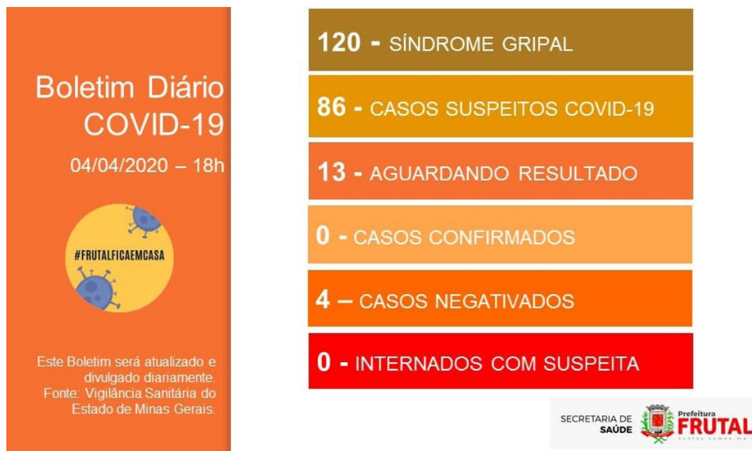
Figura 1 – Boletín Epidemiológico, 04 de abril de 2020

El primer boletín epidemiológico de la ciudad se publicó el 1 de abril de 2020. En la publicación, un arte simple fue acompañado de un texto que informaba el número de casos investigados y confirmados, las muertes en investigación y confirmadas y las hospitalizaciones, como se muestra en la Figura 1.