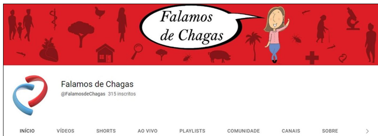
Figura 1 – Layout do canal Falamos de Chagas. Arte de Erik Costa.

Também construímos a identidade visual do canal (Figura 1), criando abas com playlists temáticas e produzindo conteúdos exclusivos, sobretudo vinculados ao dia 14 de abril de 2020, em que foi celebrado pela primeira vez o Dia Mundial da Doença de Chagas, cuja data foi escolhida durante a 72ª Assembleia Mundial da Saúde de 2019, promovida pela OMS (Ministério da Saúde, 2022), em atividades virtuais devido ao início da pandemia de covid-19. Por isso, fizemos uma live de lançamento do canal, com o objetivo de divulgá-lo em meio às comemorações do Dia Mundial da Doença de Chagas.