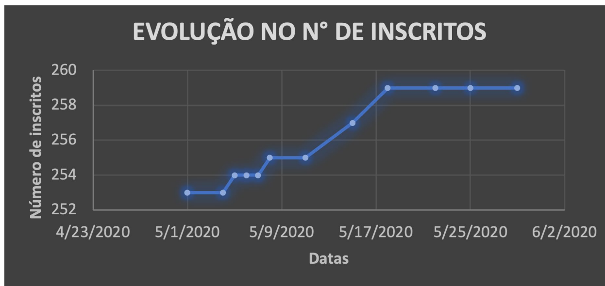
Figura 3 – Acompanhamento do número de inscritos no canal Falamos de Chagas no período de maio de 2020