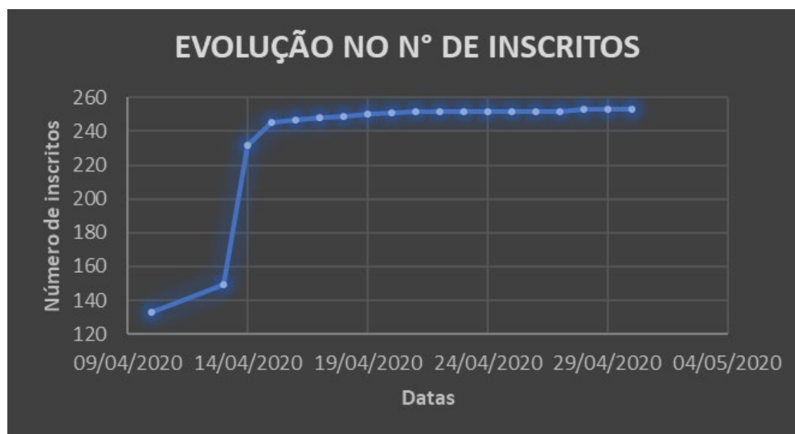
Figura 2 – Acompanhamento do número de inscritos no canal Falamos de Chagas no período de abril de 2020

Após o lançamento, entre os meses de abril e maio de 2020, todos os dias, durante dezesseis dias, em três horários diferentes escolhidos aleatoriamente, realizamos o monitoramento do canal, a partir de métricas fornecidas pelo próprio YouTube (Google Analytics), para verificar o engajamento. Observamos a evolução do número de inscritos, crescendo rapidamente após a live de divulgação do canal e mantendo a tendência elevada com o passar dos meses até a estabilidade no final do mês de maio. Nas Figuras 2 e 3, podemos ver a evolução do número de inscritos nos meses de abril e maio.