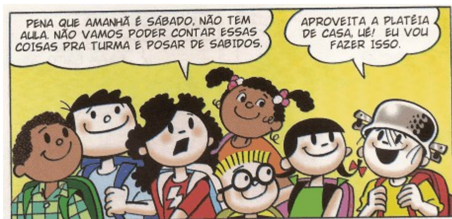
Figura 5 - Representação do público infantil.

À população adulta é atribuída a responsabilidade pela adoção de medidas de controle do vetor no ambiente doméstico. A ausência da adoção de práticas "corretas" é creditada a ausência de informação ou por descaso imputado ao indivíduo. A presença de informações cientificamente corretas é imprescindível para a compressão do agravo. Entretanto, não deve ser encarado como único fator responsável pela mudança de atitudes. O repasse da responsabilidade para o nível individual pela preservação da saúde ou de problemas de caráter social é insuficiente e resulta na manutenção de um padrão de atuação reducionista, em que os agravos não são problematizados em suas dimensões (STOTZ, 1993).