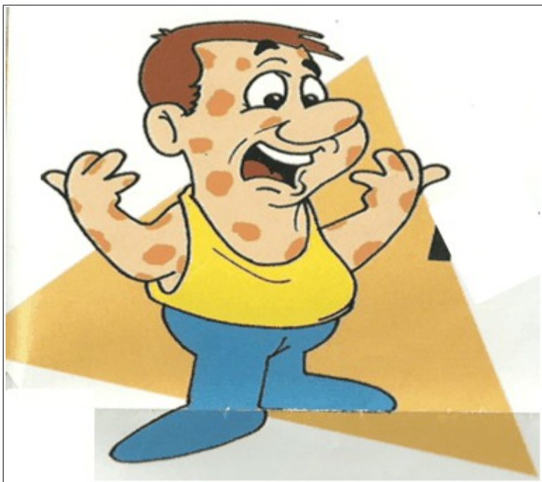
Figura 2 - Representação de petéquias, sintoma da dengue.