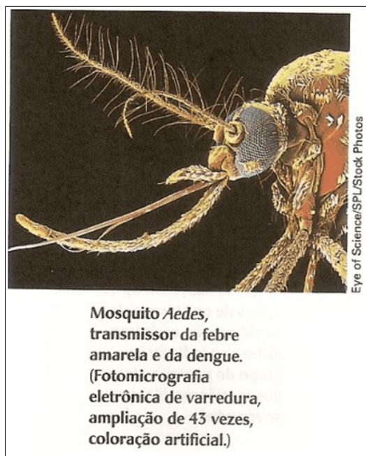
Figura 7 - Representação do vetor Aedes aegypti .